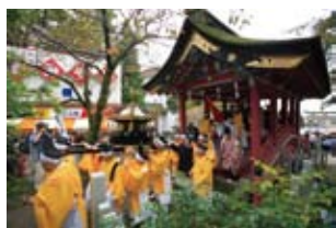
筑波山神社秋季御座替祭 御座替祭は4月1日と11月1日の年2回斎行されます。その日に限り、第三代將軍徳川家光公が寄進された御神橋をご参拝の方も渡ることができます。